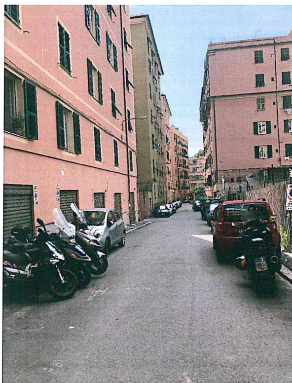
Foto 2— vista di Via V. Armirotti e dell'edificio in oggetto da nord-est