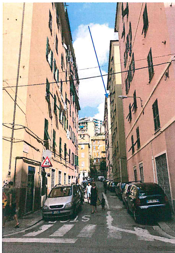
Foto 3— vista vdel contesto erso nord dal lato dell'accesso al cortile condominiale